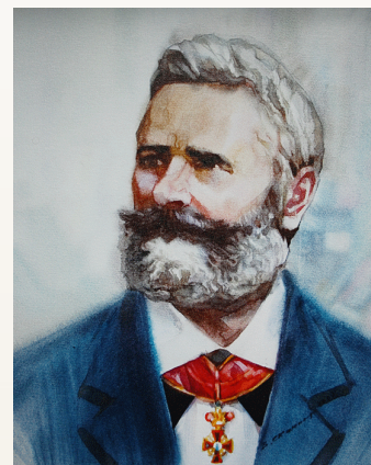
Adolf Dobriansky

Adolf Dobriansky celý život bojoval za autonómiu a samosprávu pre všetky národy v habsburskej monarchii. Podľa Dobrianskeho sa rovnoprávnosť národov Uhorska mohla uskutočniť jedine na prirodzenom princípe práva národov na sebaurčenie. V 40. rokoch 19. storočia vizionársky predpovedal štátotvorné spojenie českého, moravského, slovenského a rusínskeho národa, čo bolo dávno pred vznikom Československej republiky v roku 1918. Aj v tom tkvie politický a demokratický odkaz Adolfa Dobrianskeho dnešku.