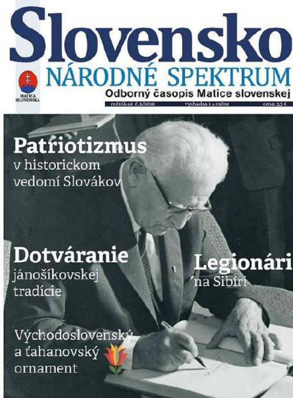
Obálky moderného odborného časopisu Slovensko – Národné spektrum.

Časopis Slovensko našim krajanom nikdy nebolo potrebné osobitne predstavovať. Niekoľko decenií vydávania kvalitných obsahov, v minulosti doplnených krajskou prílohou, ktoré poctivo pripravovala matičná redakcia v spolupráci so širokým slovenským svetom, oslovila i inšpirovala niekoľko generácií Slovákov žijúcich v zahraničí.