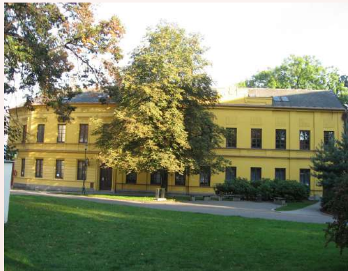
Rozsáhlý boční trakt Matičního domu v Opavě.

Vznik samostatné Československé republiky v roce 1918 paradoxně neznamenal útlum matiční činnosti, ale právě naopak. Instituce nově vzniklého státu s Maticí opavskou úzce spolu-