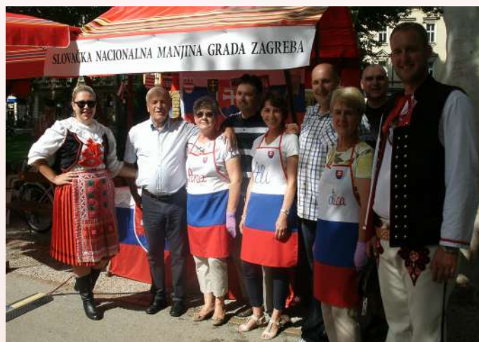
Manifestácia, Deň národnostných menšín, Záhreb.

Bez entuziazmu, pracovitých a šikovných rúk by ani jedno podujatie nemohlo byť organizované, a preto všetkým patrí veľké ĎAKUJEME.