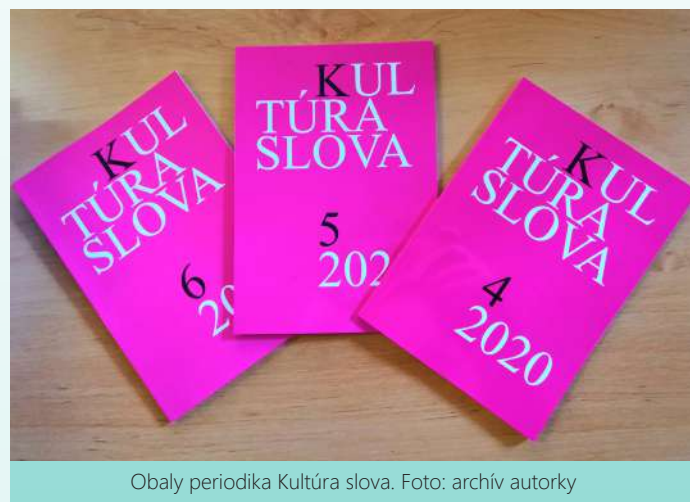
Obaly periodika Kultúra slova.