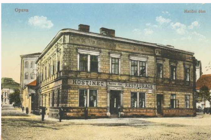
Významná historie Matičního domu v Opavě se začala psát v roce 1880, kdy se stal matičním sídlem.

Krátké oživení nastalo v roce 1968, kdy byla obnovena činnost Matice opavské a po dohodě se Slezskou maticí osvěty lidové, která po opavském vzoru působila od roku 1898 na Těšínsku, se spojila pod novým názvem „Matice slezská“. Tím svou působnost rozšířila na celé historické území českého Slezska. Plány Matice slezské byly tehdy velmi ambiciózní, avšak rok 1972 přinesl na základě politického rozhodnutí komunistických orgánů opětovné ukončení její činnosti. Teprve až „sametová revoluce“ v roce 1989, která přinesla Československu svobodu, umožnila Matice slezské znovu obnovit činnost. Z původního majetku byl Matice slezské vrácen pouze Matiční dům v Opavě, který je dnes centrem její organizační práce. Současná Matice slezská je neziskovým sdružením – spolkem, který sdružuje 16 spolků se jejich „lídři“ musí snažit bez úhony proplouvat složitým světem předpisů, musí se snažit činnost svého spolku přizpůsobit moderní době a najít pro ni dostatečné finanční zdroje. Matice slezská (a její předchůdkyně Matice opavská a Slezská matice osvěty lidové pro Těšínsko) je příkladem spolkové organizace, která se vypořádala s opakovanými pády, kdy byla její činnost omezena či přímo zakázána, kdy přišla o celý svůj majetek i postavení, a i přes nelehkou současnost stále o svou existenci hrdinně bojuje. Bez nadsázky lze o Matice slezské říct, že je „hrdinkou své doby“.