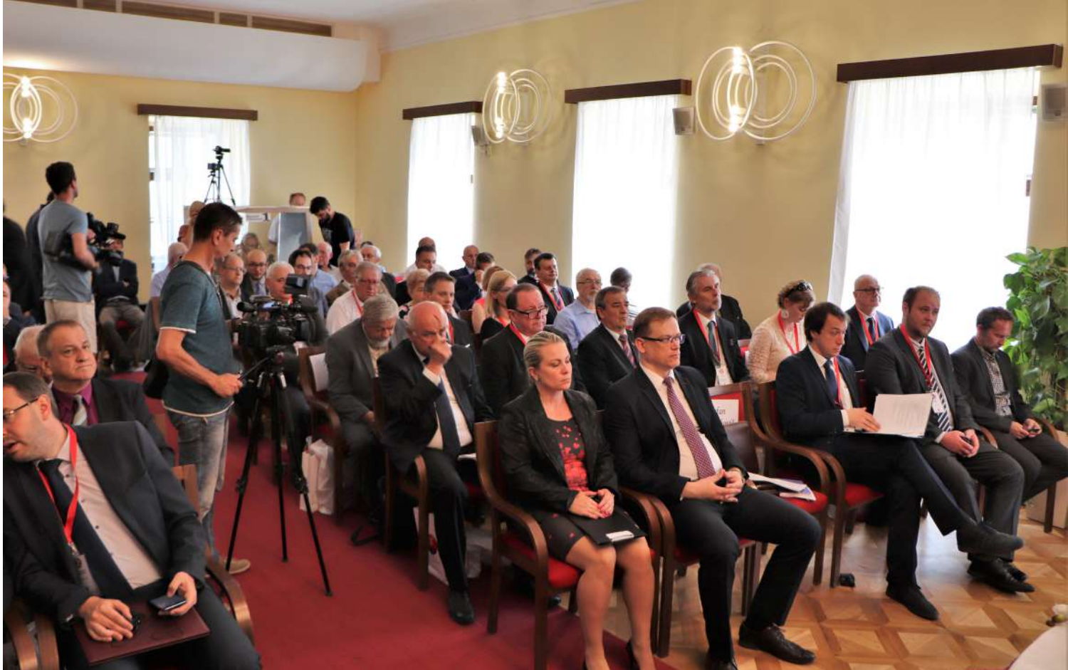
Delegáti IV. kongresu matíc slovanských národov a inštitúcií, 5. – 6. júna 2019.