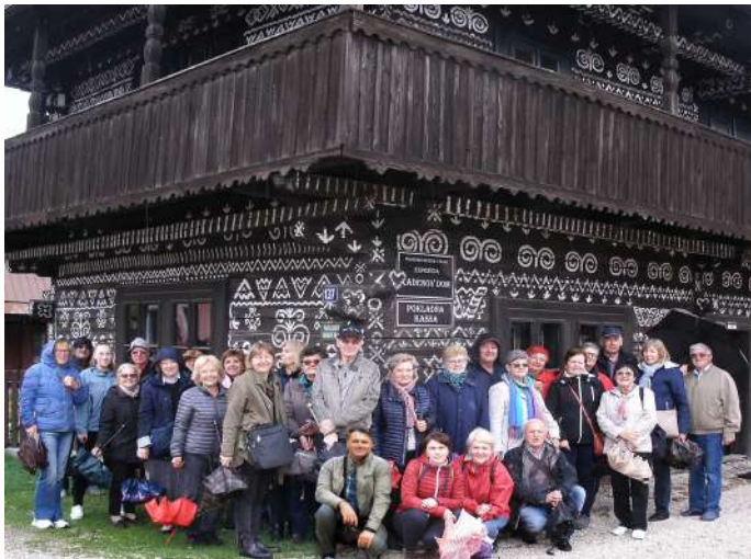
Záhrebští matičiari v Čičmanoch.

Bohužiaľ, v tomto článku nie je možné napísať všetky manifestácie, okrúhle stoly, spomienkové stretnutia, odhalenia pamätných tabúl slovenským významným osobnostiam v Chorvátsku, vianočné koncerty, projekcie dokumentárnych filmov, kultúrne večery pri príležitosti veľkonočných sviatkov, hudobné večery, študijné cesty a mnoho ďalších aktivít, ktoré MSZ uskutočnila. MSZ o aktivitách za prvých