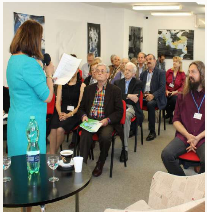
Medzinárodná konferencia organizovaná Spolkom Slovákov z Bulharska k 70. výročiu príchodu Slovákov z Bulharska do ČSR.

Je to skvelá príležitosť, ako sa dozvedieť o jednotlivých inštitúciách viac a nadviazať prospešnú spoluprácu, ktorá bezpochyby obohatí nielen krajanový život.