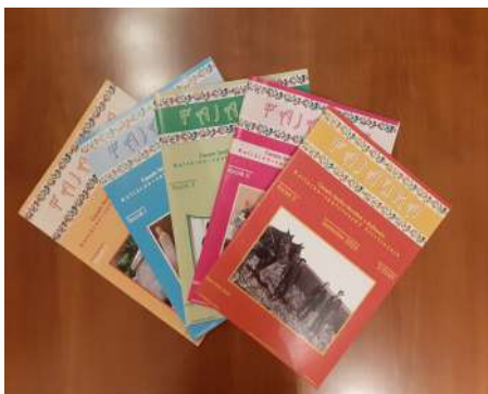
Kultúrno-spoločenský štvrtročník Spolku Slovákov z Bulharska Fajauka.