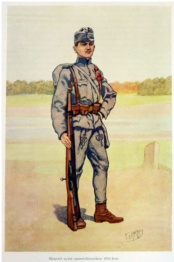
Honvéd nyári menetöltözésben 1914-ben.

100 évvel ezelőtt Európa, hazánk és a mi kis falunk is a kellős közepén volt az addigi történelem legnagyobb háborújának, melyet csak mi, utódok hívunk első világháborúnak.