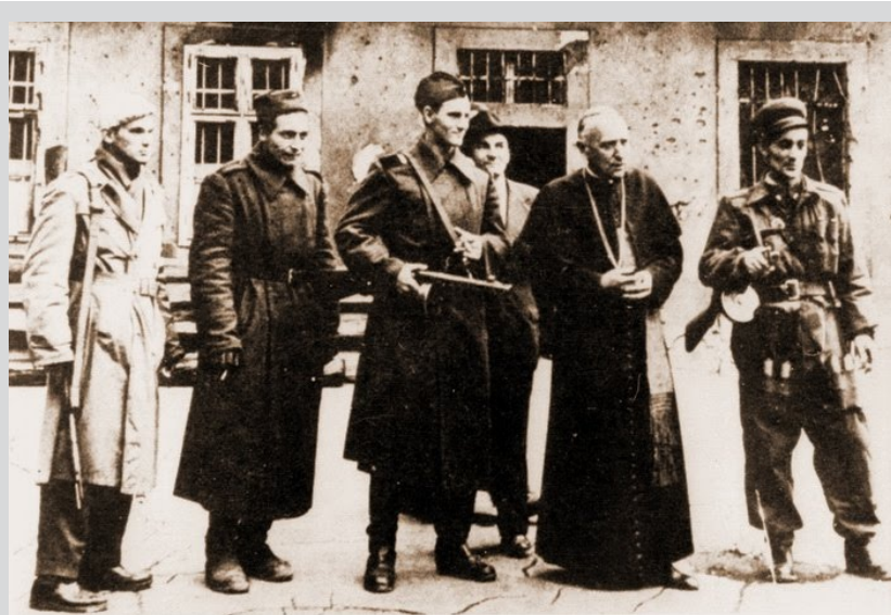
Mindszenti bíboros, hercegprímás kiszabadítása