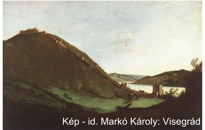
Kép - id. Markó Károly: Visegrád

Sütő András erdélyi író: „A történelem, bármennyire is a tömegek műve, egy-egy kiemelkedő személyiség karján sétál be az emlékezet házába”.